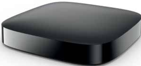
Phonak TV Connector Originalgröße

Phonak Audéo B-Direct können Sie einfach mit Ihrem TV-Gerät oder Ihrer Stereoanlage verbinden. Das macht ein neuer kleiner und kompakter Multimedia-Hub, der Phonak TV Connector, möglich. Diese Plug-and-Play-Lösung verwandelt Ihre Hörgeräte in drahtlose TV-Kopfhörer, sodass Sie Ihre Lieblingsprogramme und -filme in herausragender Stereo-Klangqualität genießen können. 2